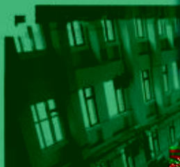
DMC 数控技术 训练场所